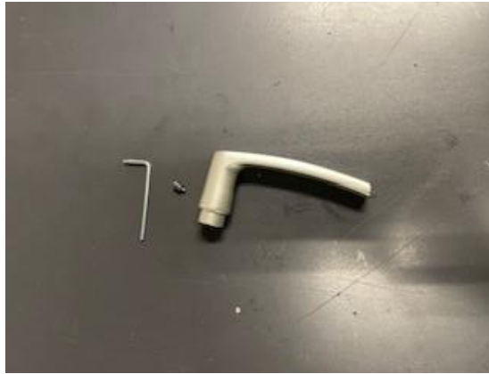
3. Draai de imbuschroef geheel uit het gatdeel