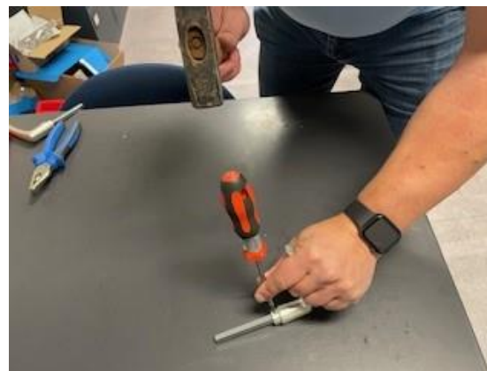
4. Sla met de kruiskopschroevendraaier een indrukking aan de binnenzijde van het stifdeel