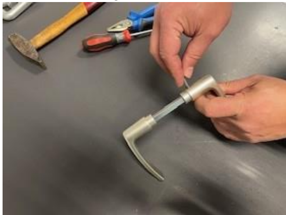
2. Draai de imbuschroef van het gatdeel los