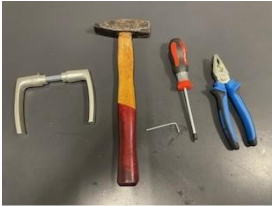
1. Deurkrukken AMI, benodigd gereedschap: kruiskop schroeven-draaier, imbusleutel 5, combinatietang en hamer