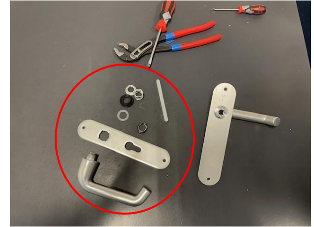
5. Gedemonteerd Rota geveerd beslag