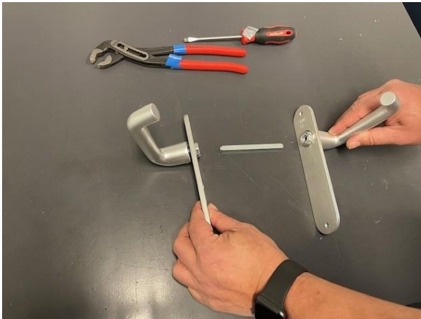
2. Haal de losse stift uit de krukken (zit er los in)