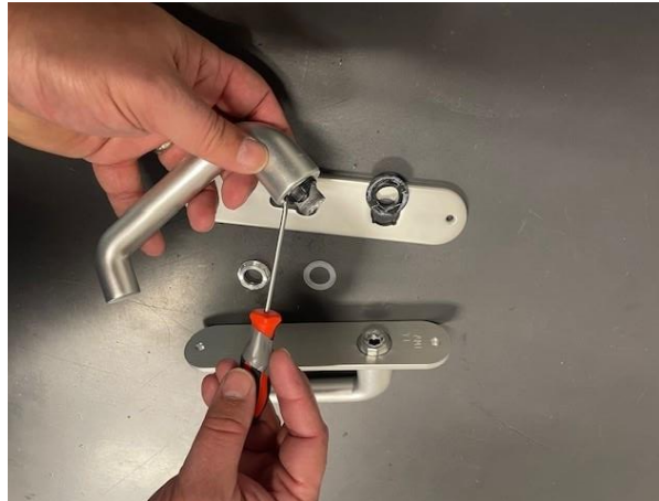
4. Verwijder de kunststof ring uit het schild en haal met de schroevendraaier de veer en kunststof ring uit de kruk