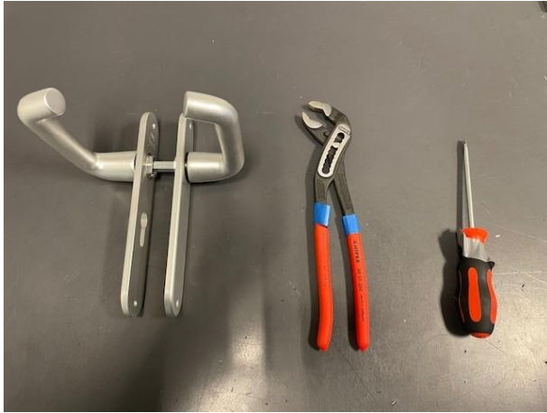
1. Rota geveerd beslag AMI, benodigd gereedschap: platte kop schroevendraaier en waterpomptang