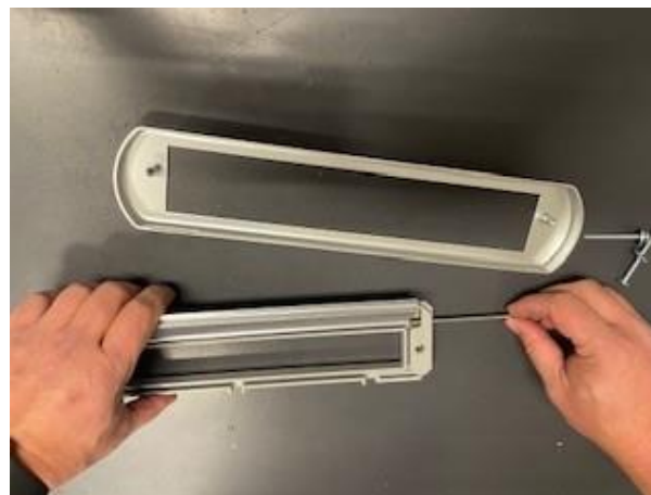
4. Trek de briefplaat uit het kunststof binnenwerk