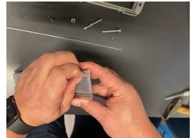
5. Trek de isolatieschuim van de briefplaat en het kunststof binnenwerk