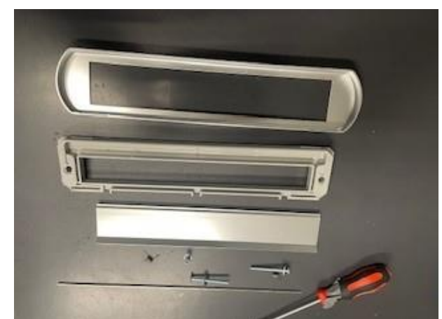
6. Gedemonteerde briefplaat AMI