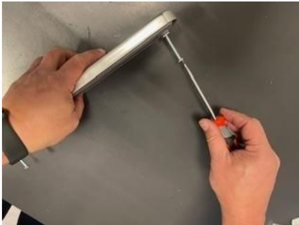
2. Draai de bevestigingsschroeven los