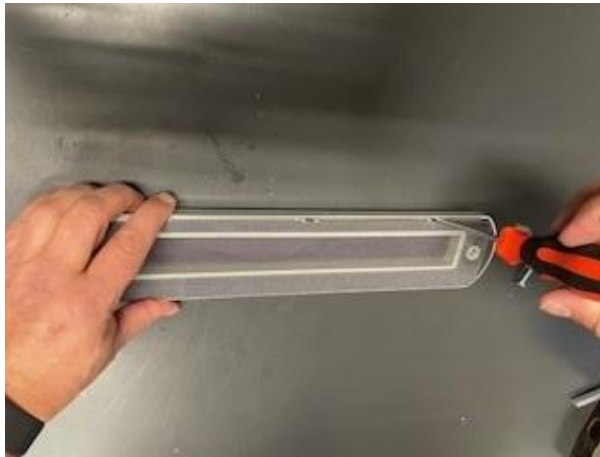
3. Klik het kunststof binnenwerk los van de aluminium raam